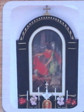
Szent Márton ábrázolás Cserdiben